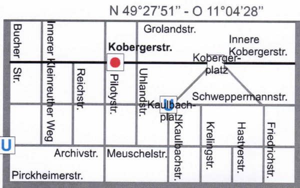
Grafik: Pia Rubner