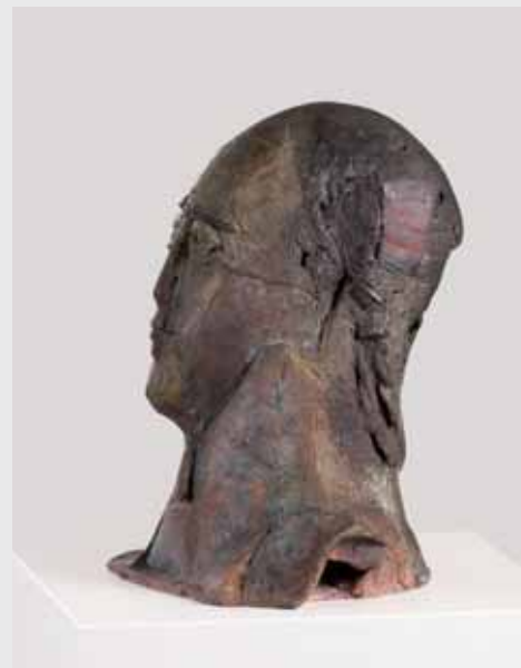
Jean-Paul-Büste 2006, Bronze, H 40cm