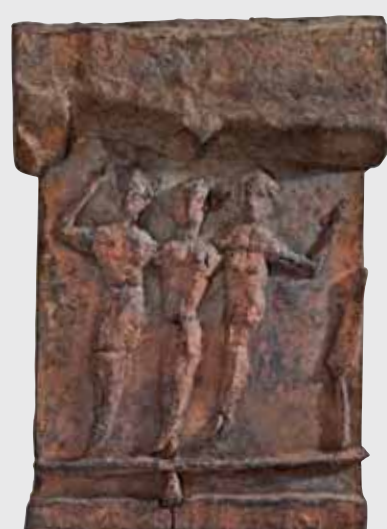
3 Grazien in Balance 2009, Bronze, H 56cm