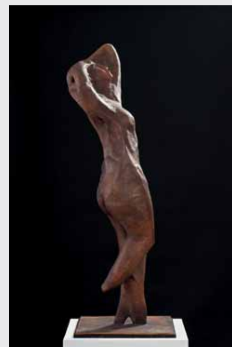
Eurydike 2012, Bronze, H 96cm