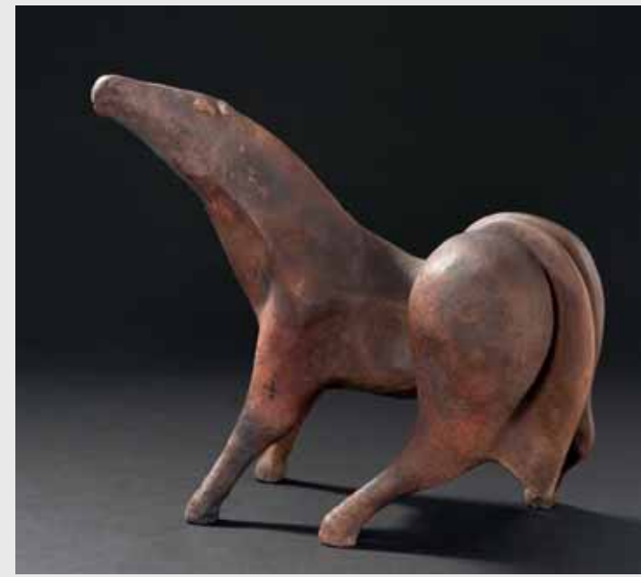
Pferd in Bewegung 2012, Bronze, H 46cm