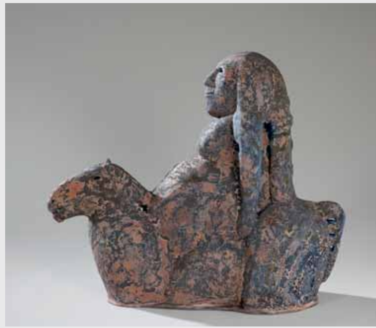
Reiterin 2009, Keramik, H 57cm