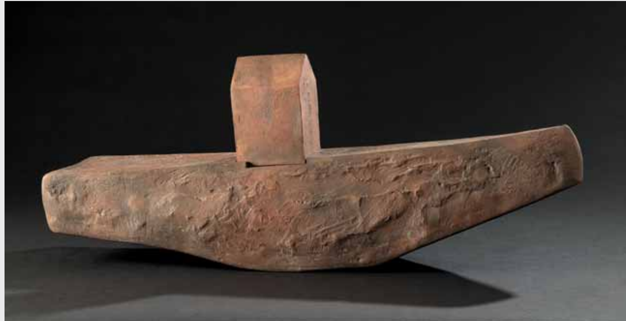
Arche 2017, Bronze, L 80cm