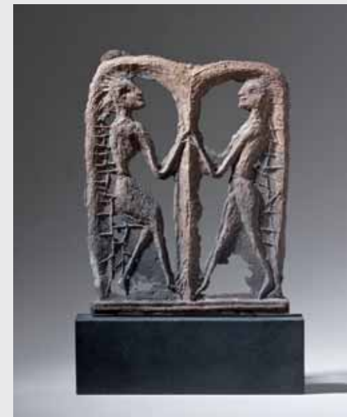
Liebender und Geliebter 2012, Bronze-Sandguss, H 43cm