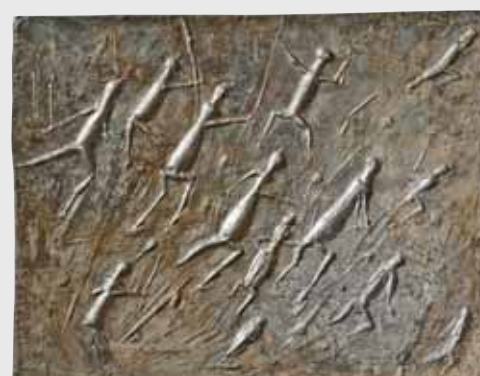
Fliehende 2009, Aluminium, B 48cm