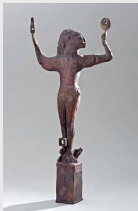
Allspieler 2012, Bronze, H 98cm