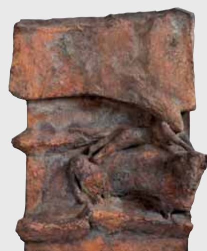
Europa & Stier 2009, Bronze, H 53cm