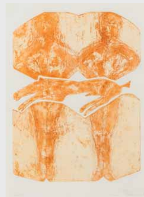
Paar mit Tier 2015, Radierung