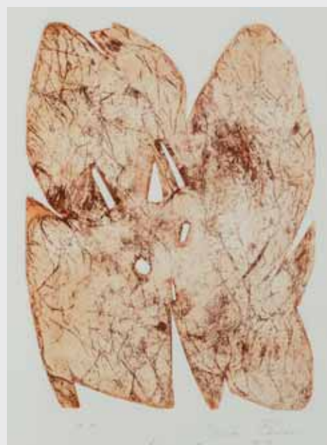
Mariposa 2014, Radierung