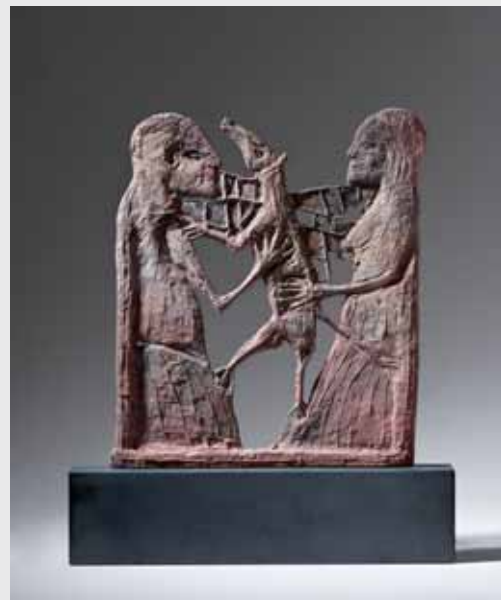
Jean-Paul u. seine Tiere 2012, Bronze-Sandguss, H 46cm