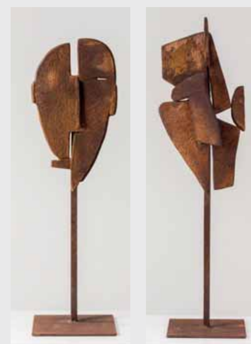
Masken 2016, Eisen, H 80cm

seit 1978 zahlreiche Einzelausstellungen und Ausstellungenbeteiligungen in Galerien und Museen, auch im Ausland u.a. in Faenza, Mailand, Arnheim, Paris, Prag, Karlsbad, Bratislava, Tokio, Kunming, Ontario